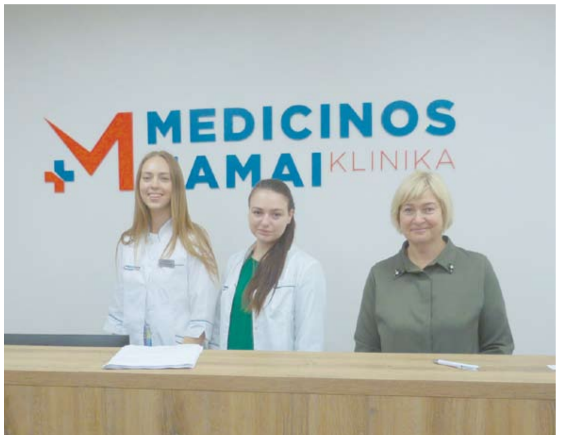
Anykščių klinika „Medicinos namai“ veikia darbo dienomis nuo 8 val. iki 17.30 val.