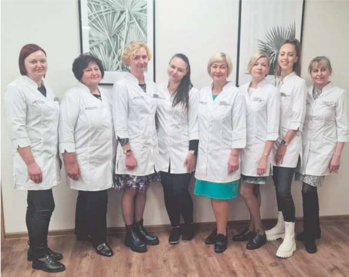
Klinikos „Medicinos namai“ pacientus priims rūpestinga komanda.