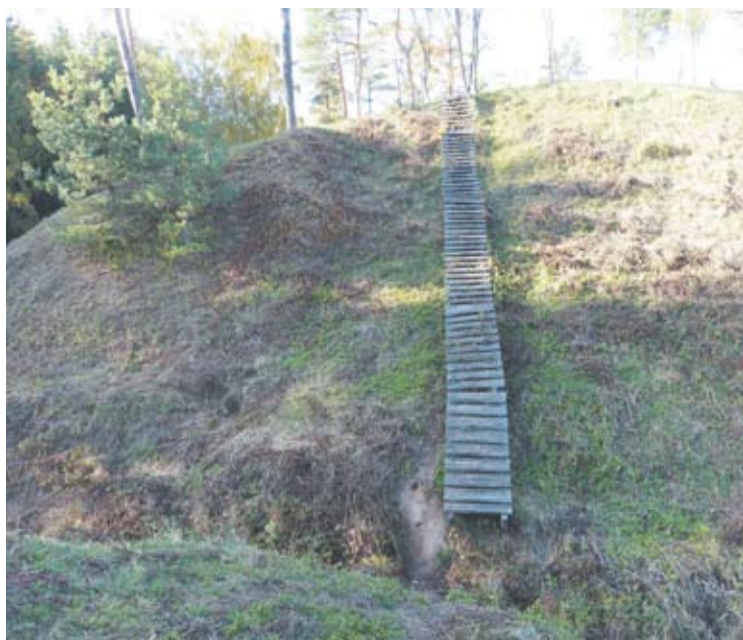
Į šiaurės vakarinę papilį gali patekti tik atkakliausi turistai - nėra lieptelio ir dalies laiptų.