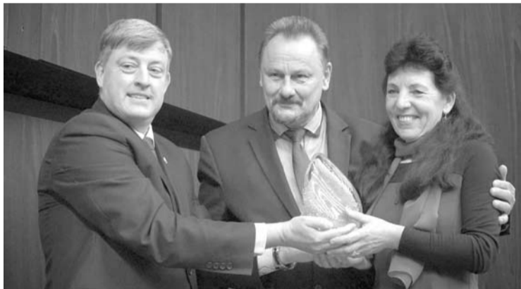
Pedagogus sveikino Anykščių rajono savivaldybės vadovai.

Spalio 5 dieną, antradienį, minint Tarptautinę mokytojų dieną, Anykščių kultūros centre vykusiame renginyje paskelbtas „Geriausias metų mokytojas“.